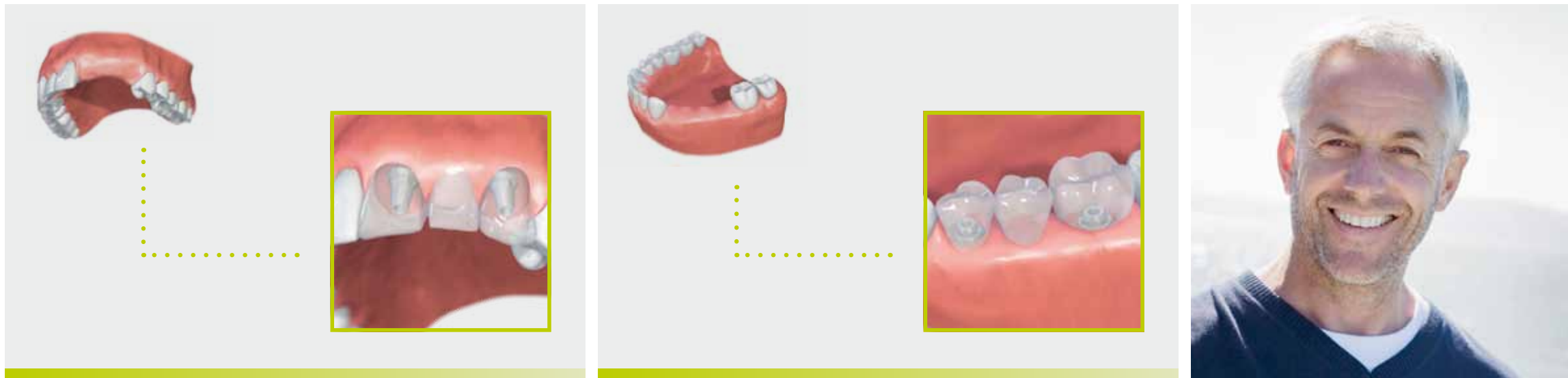
Sustitución de varios dientes en la zona frontal o lateral con implantes dentales.