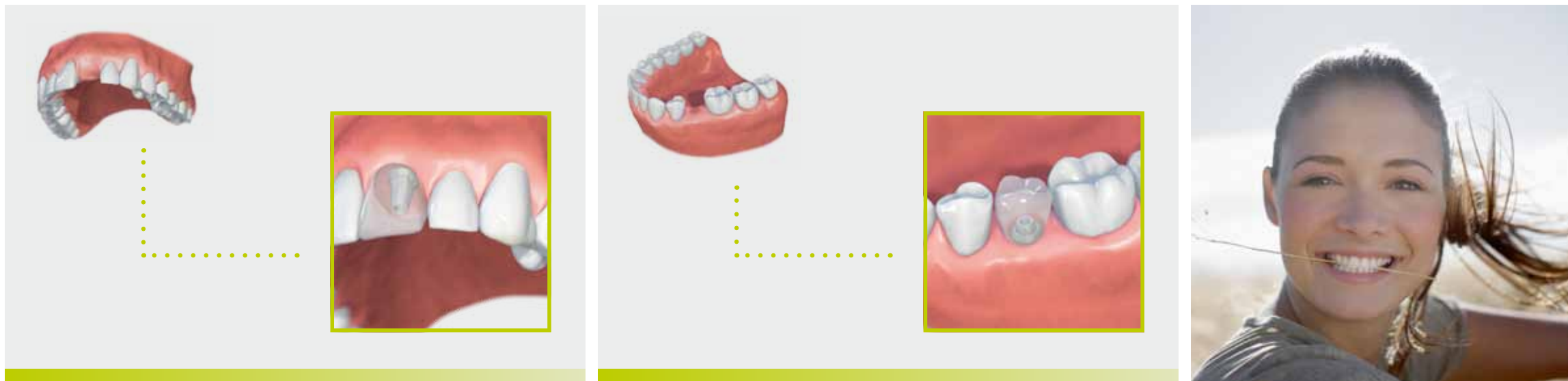
Sustitución de un único diente en la zona frontal o lateral con un implante dental.